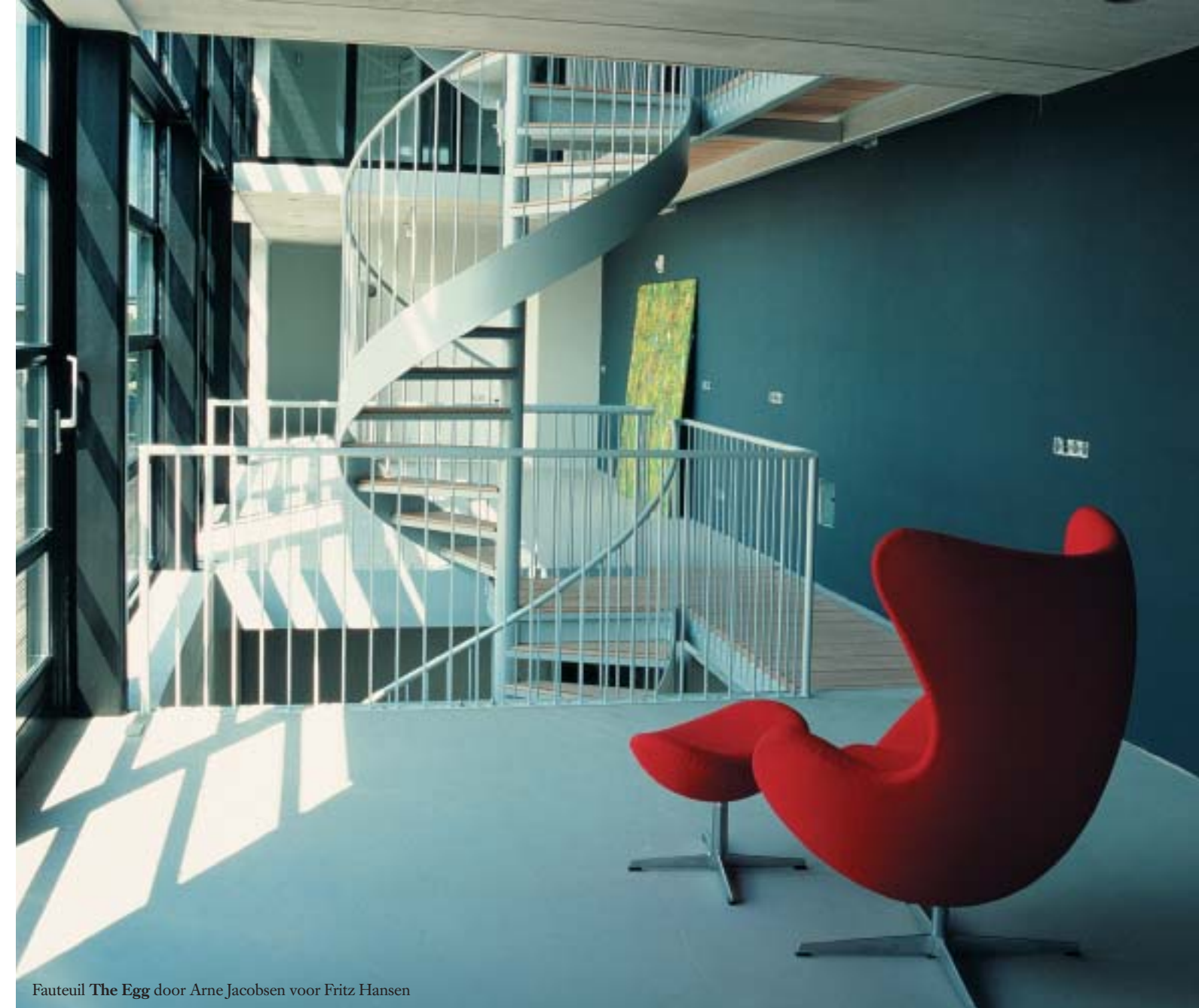
Fauteuil The Egg door Arne Jacobsen voor Fritz Hansen